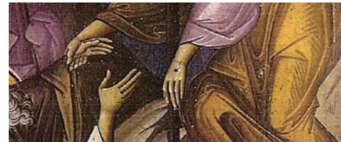
Ο Μητροπολίτης ΠΕΙΡΑΙΩΣ ΣΕΡΑΦΕΙΜ

Η Εκκλησία μας τους περιμένει με αδημονία για να τους βοηθήσει να ξαναβρουν την αληθινή Πίστη, από τον Κύριο «άπαξ παραδοθείση τοις αγίοις» (Ιουδ.3), διότι η αλήθεια υπάρχει μόνο μέσα στην Εκκλησία, η οποία, Μόνη Αυτή, είναι ο «στόλος και (το) εδραίωμα της αληθείας» (Α' Τιμ.3,15) και έξω από Αυτή δεν υπάρχει σωτηρία, αλλά απώλεια και αιώνιος θάνατος (Ιωάν.15,1-8).